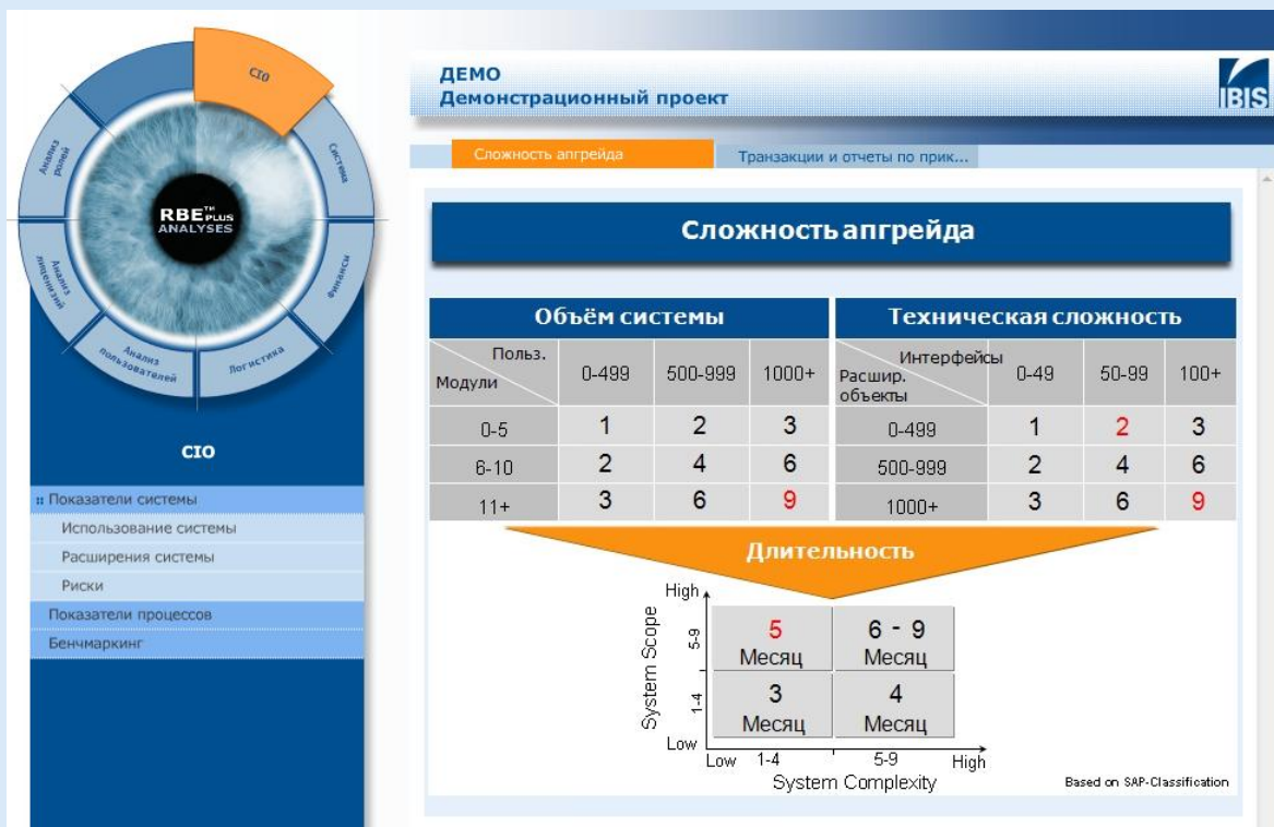
Отчет для ИТ-директора: оценка сложности апгрейда

В отчет для ИТ-директора (CIO summary) входят ключевые факты и цифры, получаемые в результате регулярного наблюдения за использованием системы. Отчет представляет собой краткий обзор, в котором раскрываются технические и бизнес-аспекты, указывается на потенциальные угрозы безопасности и отклонения от нормы. Благодаря этому использование системы становится более «прозрачным» для ИТ-директоров и менеджеров проектов.