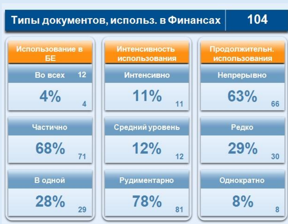
Профиль использования типов документов в Финансах (Usage profiles)