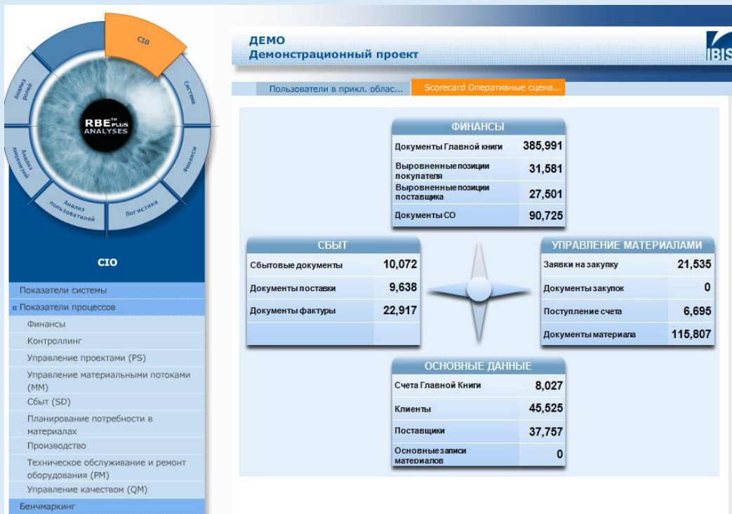
Отчет для ИТ-директора: оценка процессов